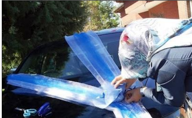
Resim 2.15: Ara sslenmesi

Sslenecek snnet aracı ie balamadan nce yıkanmı ve temizlenmi olmalıdır. Sslenecek aracının st aık veya kapalı olması sslenme esnasında ufak farklılık olumasına neden olabilir. Bu nedenle konseptte uygun ve snnet arabası olarak kullanılacak arabanın zelliğine gre ssleme yapılmalıdır. st kapalı bir ara sslenirken nce tller yerletirilmelidir. Bu amala ara ebat ve rengine uygun olarak tl, elyaf veya rabant kesilir. Kesilen bu malzemeler n tampondan arka tampona kadar ekilir. Bu tr sslemelerde maallah terimini desteklediđi dnlen nazar boncuđu desenlerinden olumu malzemeler daha ok tercih edilmektedir.