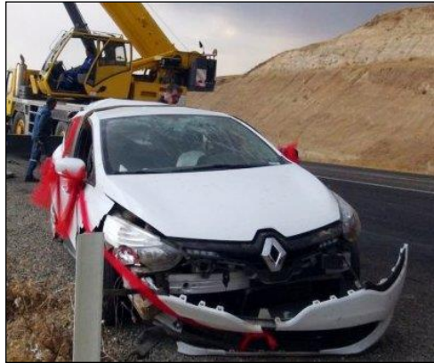
Resim 1.27: Kaza yapmış gelin aracı