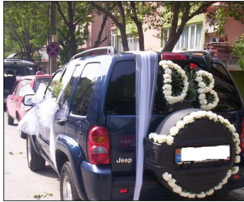
Resim 1.21: Gelin ve damadın isminin yazılması

Ayrıca ülkemizde gelin araçlarının arka camı üzerine gelin ve damadın isimlerinin baş harfleri (üst kısımda gelinin isminin baş harfi olmak üzere) kalp ile bant ile yapıştırılmaktadır.