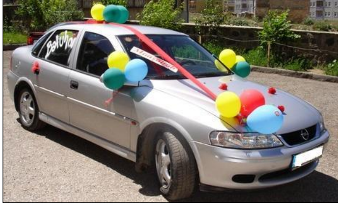
Resim 2.18: Balonlarla süslenmiş araç

Müşteri tercihinine göre aracın çeşitli yerlerine manyetik özelliği olan mıknatıs parçaları destekli süsler yapıştırılabilir. Genellikle nazar boncuklu veya çizgi film kahramanlarının resmi olan mıknatıslı yapıştırıcılar tercih edilmektedir. Bunlar küçük çocukların ve sünnet çocuğunun dikkatini çekmekte ve çocukların mutlu olmasına katkıda bulunmaktadır.