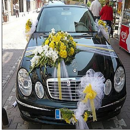
Resim 1.2: Zarif bir şekilde süslenmiş araç

Ülkemiz gelin arabası süsleme sanatı bakımından Avrupa'nın önüne geçmiş durumdadır. Teknolojik gelişmelere de açık olan gelin arabası süslemesi artık bir sanat dalı haline gelmiştir. Gelin ve damadı buldukları evlerinin çevresinden konvoy yaparak düğün salonuna, otele veya nikah salonuna en zarif görünümlü süsleme ile götürmek önemli bir işlem olup, bu işlem bir titizlik ve özen gerektirir.