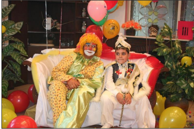
Resim 2.1: Sünnet töreni

Sünnet, erkek çocuklarının buluş çağına girmeden İslam ülkelerinde ve diğer bazı dinlerde uygulanan dinsel bir gelenektir. Ülkemizde de erkek çocuklarla ilgili geleneksel işlemlerin en önemlilerinden biriside sünnettir. Çocuklar çoğunlukla okul çağına yakın veya ilkokul yıllarında, ergenlik çağına girmeden sünnet edilmektedirler. Ülkemizde sünnet törenleri bir düğün şeklinde yapılır.