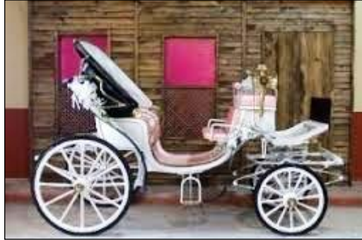
Resim 2.13: Fayton