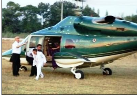
Resim 2.4: Sünnet aracı olarak helikopter

Sünnet törenleri ülkemizde bölgesel farklılıklar gösterir. Anadolu'nun hemen her yöresinde sünnet çocuğun ilk mürüvveti olarak kabul edildiğinden, ailenin maddi durumuna göre küçük bir tören veya düğün yapılır. Bugün sünnet düğünü özellikle büyük kentlerde değişik bir nitelik kazanmıştır. Salon tutup düğün yapanlar yanında sade törenleri tercih edenler de vardır.