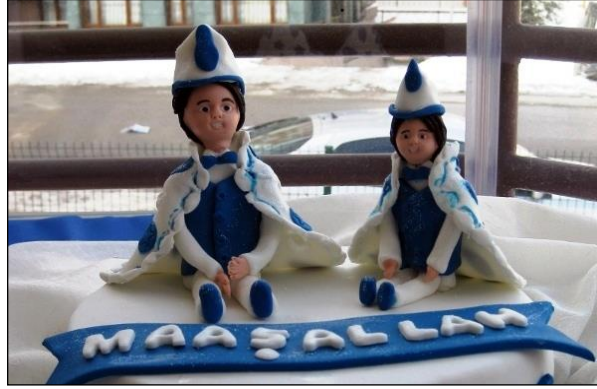
Resim 2.16: Sünnet aracı süslemeleri

Sünnet aracı süslemelerinde kullanılacak çiçeklerin müşteri tercihine uygun, dayanıklı, ekonomik, arabanın rengine uygun ve mevsim çiçeklerinden seçilmesi gerekir. Süslemede canlı çiçek olarak daha çok gül, karanfil, lilyum, gerbera, kasımpatı, şebboy, lale, krizantem tercih edilmektedir. Fakat tercihe bağlı olarak diğer çiçeklerde kullanılabilir. Çiçeklerin çabuk solmaması ve canlılığını uzun süre koruması amacıyla oasis ıslatılır. Çiçekler ve yeşillikler oasis üzerine yerleştirilir. Hazırlanan aranjmanlar aracın ön kaputun üzerine sağlam bir şekilde yerleştirilir. Aranjmanın rüzgâr ve arabanın hızından uçmaması için gerekli tedbirler alınır.