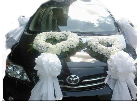
Resim 1.24: Karma süsleme

Karma süsleme yönteminde çiçekler ve tüller kullanılır. Bu süsleme tarzında çok fazla seçenek bulunmaktadır. Sadece arabanın önüne veya sağ-sol far üstüne gelecek şekilde aranjman yapılan bir çiçek konur. Diğer süslemeleri ise, tül, kurdele, keten ve renkli bez çeşitleriyle, ağırlıklı olarak yapılan süslemedir.