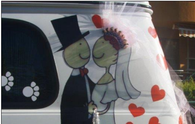
Resim 1.5: Değişik bir tasarım

Gelin ve damadın en mutlu ve en güzel gününde araç seçimine çok özen gösterilmelidir. Çünkü gelin aracı süsleme işlemi düğünün vazgeçilmezlerindedir. Gelin aracı, gelin ve damadın o özel günde mutluluklarını en iyi anlatacak şekilde giydirilmelidir. İster çiçeklerle, kurdelelerle, tüllerle donatılsın, ister daha farklı dokunuşlarla şekillendirilsin arabalar mutlaka renklendirilmelidir.