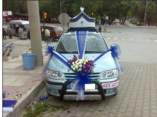
Resim 2.8: Değişik bir tasarım

Günümüzde en çok kullanılan sünnet araçları otomobillerdir. Bu otomobillerin genellikle üstü açık olanları tercih edilmektedir. Çünkü sünnet kıyafetleri giydirilmiş çocuğun eline asasını alıp ayakta durarak veya oturtularak gezdirilmesi bir gelenek halini almıştır.