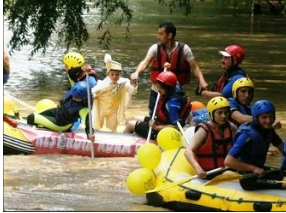
Resim 2.5: Sünnet aracı olarak kullanılan bot

Sünnet aracının süslenmesi düğün hazırlıkları ile başlar. Geçmişimizden günümüze kadar düğünlerde gelin ve damadın ayaklarının nasıl yerden kesilmesi bir gelenek halini almışsa, sünnet olacak çocuğun ayaklarının yerden kesilmesi de bir gelenek şeklinde sürdürülmektedir.