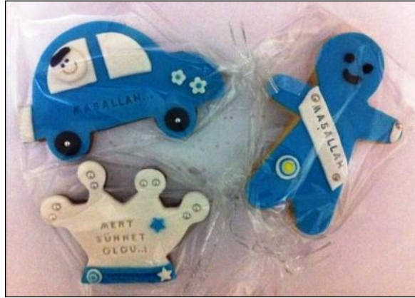
Resim 2.19: Süsleme malzemeleri

Müşteri tercihinine göre aracın çeşitli yerlerine manyetik özelliği olan mıknatıs parçaları destekli süsler yapıştırılabilir. Genellikle nazar boncuklu veya çizgi film kahramanlarının resmi olan mıknatıslı yapıştırıcılar tercih edilmektedir. Bunlar küçük çocukların ve sünnet çocuğunun dikkatini çekmekte ve çocukların mutlu olmasına katkıda bulunmaktadır.