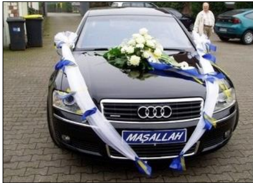
Resim 2.3: Sünnet aracı olarak kullanılan otomobil

Sünnet aracı, çeşitli şekillerde süslenmiş ve arabaların farklı yerlerine sünnet törenini destekleyici yazılar yazılmış bir araçtır. Çocuğu sünnet aracı ile gezdirme aile için bir gurur ve gövde gösterisi olmaktadır. Bu nedenle sünnet aracı, ailenin o özel günde mutluluklarını en iyi anlatacak şekilde süslenmelidir. İster çiçeklerle, balonlarla donatılsın, ister daha farklı dokunuşlarla şekillendirilsin arabalar mutlaka renklendirilir. Böylece süslenen araba şölenin bütünleyicilik kısmı içerisinde önem kazanmış olmaktadır.