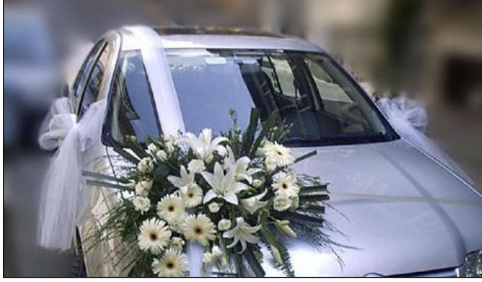
Resim 1.22: Sade süsleme

Sade süslemenin farklı tarafı aracın diğer arabalardan farklı renkte ve farklı modelde olmasıdır. Bu araç limuzin veya uzun kasa araçlardan biri olabilir. Bu yöntemin tek özelliği dikiz aynalarına kurdele veya havlu bağlanmasıdır.