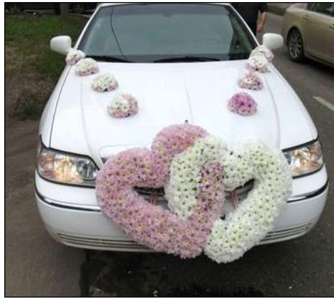
Resim 1.23: Çiçekle süsleme

Bu yöntemde süsleme elemanlarının çoğunluğu çiçeklerden oluşmaktadır. Bu tip süslemede başta gül ve karanfil olmak üzere birçok çiçek çeşidi kullanılabilir. Aracın kendisinden çok üzerindeki çiçeklerin çokluğu dikkat çeker. Gelin aracını boydan boya çevreleyen güller gösterişli bir hava meydana getirmektedir.