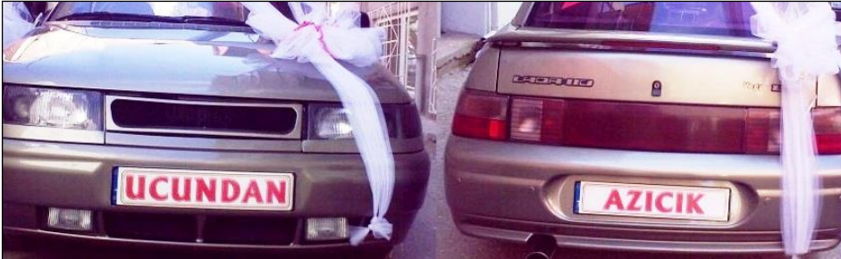
Resim 2.17: Araç üzerine yazılan yazılar

Sünnet araçlarının vazgeçilmezlerinden olan yazılı bantlar arabanın aracın ön camına ve şoförün görüşünü engellemeyecek şekilde yapıştırılmalıdır. Ülkemizde bu bantlar üzerine genellikle maşallah ve ucundan azıcık gibi ifadeler yazılmaktadır.