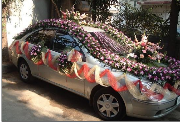
Resim 1.16: Trafiki tehlikeye atacak şekilde süslenmiş araç