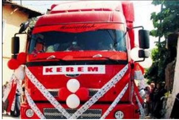
Resim 2.12: Sunnet aracı olarak süslemiş kamyon