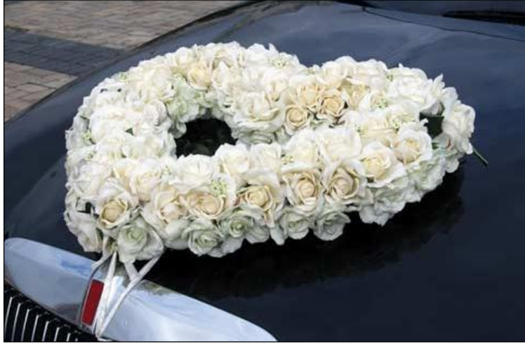
Resim 1.19: Çiçekle süslenmiş araç

Aracın ön kısmına yerleştirilecek çiçek aranjmanları oasis adı verilen süngerimsi bir malzeme üzerine yapılmalıdır. Oasis, çiçeğin ihtiyaç duyduğu suyu bünyesinde barındırarak çiçeğin nemli kalmasını ve canlılığının düğün bitene kadar korumasını sağlar.