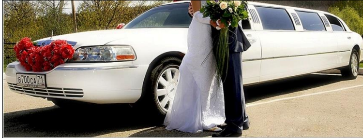
Resim 1.3: Gelin aracı

Evlilik, evlenecek kişiler için yeni bir hayata başlamak anlamına gelir. Bu amaçla yapılacak törende gelin ve damat düğün alanına geçmişte olduğu gibi günümüzde de bir araçla gelmektedir. Bu araç sıradan olmayıp günün anlamına uygun olarak süslenmektedir. Düğün aracını süslerken uygulanacak tasarım ve kullanılacak malzemeler özenle seçilmelidir.