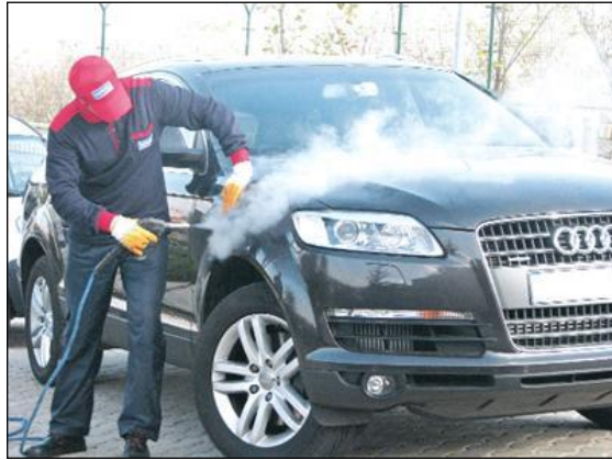
Resim 1.17: Süsleme öncesi aracın yıkanması

Gelin aracı süslemede aranacak ilk şart aracın temiz olmasıdır. Bu amaçla gelin aracı önce yıkama servislerinde tamamen temizlenmelidir. Temizlenen araç süslemenin yapılacağı mekana teslim edilmelidir.