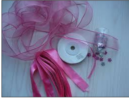
Resim 1.11: Süsleme malzemeleri

Kullanılacak malzemelerin aracın kaportasına zarar vermemesine ve süslemenin araçta kalıcı izler bırakmamasına dikkat edilmelidir. Bu nedenle seloteyp, bant, zambak gibi yapıştırıcılar araba süsleyicileri tarafından pek tercih edilmez. Bunların yerine uygulaması ve temizlenmesi daha kolay olan köpük spreylere son yıllarda kullanılmaya başlanmıştır. Ayrıca kullanılacak malzemelerin olası bir yağış durumunda malzemeler yağmurdan etkilenmeyen ve kolay temizlenebilen özellikte olmasına dikkat edilmelidir.