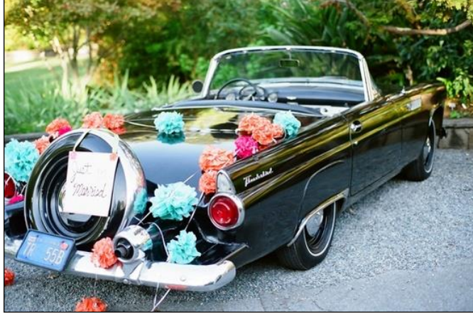
Resim 1.8: Gelin aracı olarak eski model bir araç

Düğünlerine renk katmak isteyen, nostalji anıları yaşamak isteyen ve maddi durumu iyi olan insanlar ise limuzin, gemi, tekne, uçak ve eski model otomobil gibi araçları düğün aracı olarak kullanmaktadırlar.