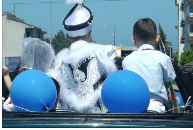
Resim 2.20: Araçta ayakta duran çocuk