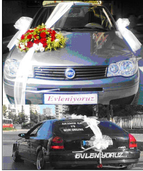
Resim 1.20: Düğün aracı yazıları

Ayrıca ülkemizde gelin araçlarının arka camı üzerine gelin ve damadın isimlerinin baş harfleri (üst kısımda gelinin isminin baş harfi olmak üzere) kalp ile bant ile yapıştırılmaktadır.