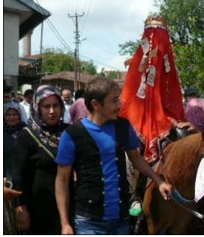
Resim 1.4: Gelinin at üzerinde damat evine gidişi

Hem ülkemizde hem de dünyada yapılan düğün törenlerinde gelin ve damadın düğün alanına araçla gelmesi bir gelenektir. Ülkemizde geçmiş zamanlarda özellikle kırsal bölgelerde gelin, evinden alınmaya gidildiğinde bir at üzerinde veya at yoksa kağı benzeri araçla damat evine getirilirdi.