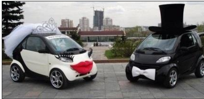
Resim 1.13: Farklı gelin aracı tasarımları

Tasarım çok dikkat edilmesi gereken bir çalışmadır. Gelin aracı süsleme tasarımı yapılırken tasarım aşamasında, yapım tekniği, kullanılacak malzemenin renk uyumu, konsept uyumu, estetik, çekicilik, müşteri isteği gibi birçok faktör göz önünde bulundurulmalıdır. Tasarım yapılırken dikkat edilmesi gereken başlıca hususlar şunlardır: