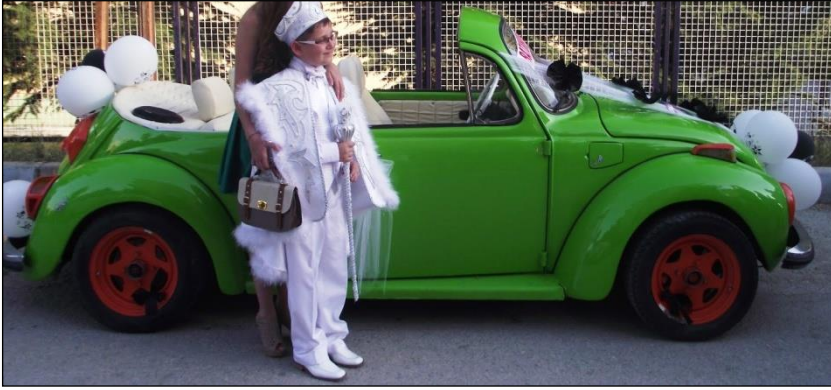
Resim 2.2: Sünnet için süslenmiş araç

Ülkemizde yapılacak sünnet düğünlerinde çeşitli ön hazırlıklar bulunmaktadır. Bu hazırlıklardan bir tanesi de sünnet olacak çocuk için hazırlanacak sünnet aracıdır. Sünnet aracının gelişigüzel olmaması gerekir. Özenle süslenmiş bir araç sünnet düğününe ayrı bir önem katar. Bu amaçla ülkemizde değişik süsleme tasarımları uygulanmaktadır.