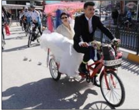
Resim 1.7: Gelin aracı olarak kullanılan bisiklet

Gelin aracı kullanımında bölgenin sosyal yapısı, ekonomik faktörler, kişilerin hayal gücü gibi faktörler önemli rol oynamaktadır. Örneğin Asya'nın doğusu, Ortadoğu ve kırsal kesimler ile teknolojiye uzak olan bölgelerde bisiklet, traktör, at ve at arabası vb. araçlar kullanılmaktadır. Bu araçlar Hindistan, Tayvan, Afganistan gibi dünyanın birçok ülkesinde kullanılmaktadır.