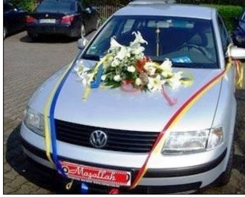
Resim 2.14: Kurdelelerle sslenmi ara

Snnet aracı ssleme iini, bu iin ustası olan iek dzenleyicileri yapmalıdır. Snnet aracı sslenirken belirli bir plan dahilinde ssleme ilemi gerekletirilmelidir. Bazı arabalar ieklerle sslenerek iekler n planda tutulur, bazı araba sslemelerinde ise sade bir kurdele ekimiyle balonlar n planda tutulabilir. Snnet aracı ssleme aamaları uygulayıcı tarafından belirlenmeli ve istenilen srede tamamlanmalıdır.