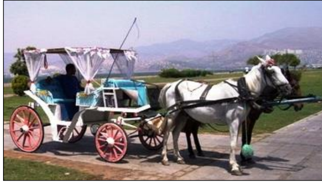
Resim 2.7: Sünnet aracı olarak süslenmiş fayton

Günümüzde en çok kullanılan sünnet araçları otomobillerdir. Bu otomobillerin genellikle üstü açık olanları tercih edilmektedir. Çünkü sünnet kıyafetleri giydirilmiş çocuğun eline asasını alıp ayakta durarak veya oturtularak gezdirilmesi bir gelenek halini almıştır.