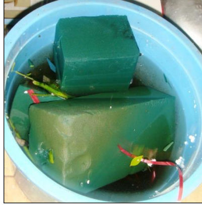
Resim 1.10: Su içinde bekletilen oasis

Kullanılacak malzemelerin aracın kaportasına zarar vermemesine ve süslemenin araçta kalıcı izler bırakmamasına dikkat edilmelidir. Bu nedenle seloteyp, bant, zambak gibi yapıştırıcılar araba süsleyicileri tarafından pek tercih edilmez. Bunların yerine uygulaması ve temizlenmesi daha kolay olan köpük spreylere son yıllarda kullanılmaya başlanmıştır. Ayrıca kullanılacak malzemelerin olası bir yağış durumunda malzemeler yağmurdan etkilenmeyen ve kolay temizlenebilen özellikte olmasına dikkat edilmelidir.