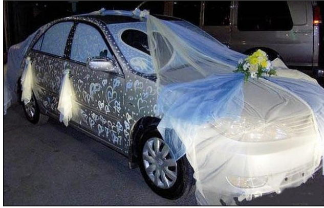
Resim 1.26: Elektronik süsleme

Elektronik süsleme gece düğünlerinde kullanılan ve pahalı bir yöntemdir. Arabanın alt aksesuarı ışıklı, üst aksesuarı ise lazerli lambalarla yapılan bir süsleme sanatıdır. Fakat bu tür süsleme yapılırken trafik kurallarına uygun ve karşısındakinin gözünü almayacak şekilde renkli ışık donanımının yapılması gerekmektedir. Bu süslemede lazerli olduğu için genelde arabanın tavanına konulan lazer lambalarının gösterdiği hareketli; seni seviyorum, dans eden çift, isim baş harfleri gibi görüntüler kullanılabilir. Elektronik süsleme sadece elektronikçilere mahsustur. Bu süsleme yöntemi Çin, Japonya ve ABD gibi ülkelerde sıklıkla kullanılırken Türkiye’de ise nadiren yapılan bir tarzıdır.