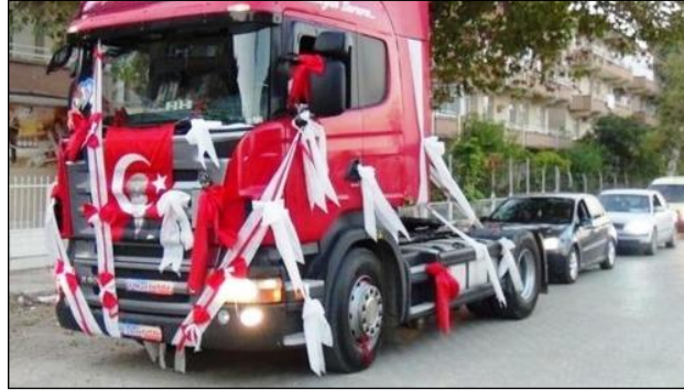
Resim 1.9: Gelin aracı olarak süslenmiş kamyon

Ülkemiz, gelin aracı süslemesinde son yıllarda önemli mesafeler kat etmiş ve araç süsleme sanatındaki yeni teknolojileri yakalamayı başarmıştır. Örneğin Rusya, Türk Cumhuriyetleri ve Avrupa'nın bazı ülkelerinde olduğu gibi arabanın önüne bir bebek konup üzeri kurdele ve karanfillerle süslenen araba modelleri yerine daha modern tasarımlar yapılmaya başlanmıştır.