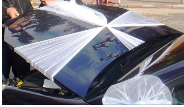
Resim 1.18: Tüllerin bağlanması

Aracın süslenmesinde temel unsur ön tampondan arka tampona çekilen tül ve arabanın ön kaputun üstüne yerleştirilen çiçeklerden oluşmuş aranjmandır.