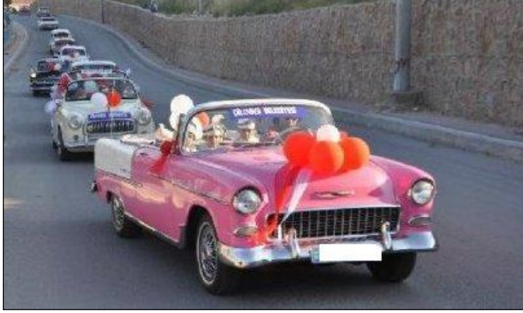
Resim 2.9: Sünnet düğünü konvoyu

Sünnet törenlerinde genellikle araç konvoyları yapılır. Günün önemine bağlı olarak sünnet aracının konvoydaki en gösterişli araç olması gereklidir. Bu nedenle sünnet aracının süslenmesi, sünnet düğünlerinin önemli aşamalarından biridir. Sünnet aracının düzenlemesi çok ciddi bir titizlik ve özen gerektirir.