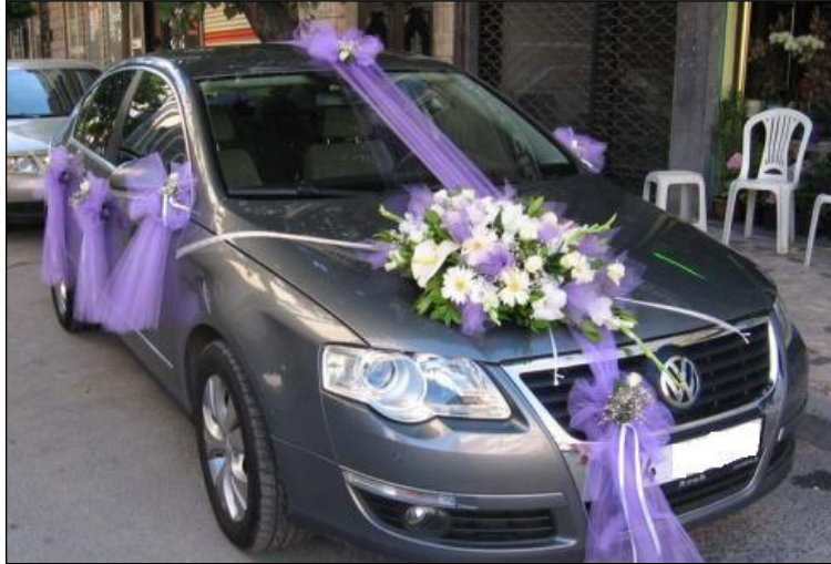
Resim 1.1: Süslenmiş gelin aracı

Gelin aracı süslemesi, insan hayatının en önemli günlerinden biri olan evliliğin vazgeçilmez âdetlerinden bir tanesidir. Yeni evlenecek olan çiftlerin arabaları mutlaka süslenir.