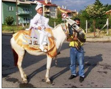
Resim 2.6: Sünnet çocuğunun at üzerinde gezdirilmesi