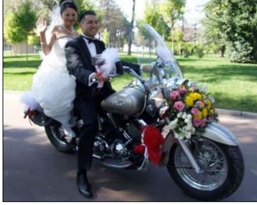
Resim 1.14: Müşteri isteğine göre düzenlenmiş araç