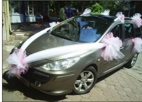
Resim 1.25: Sadece tül ve kumaşla süsleme

Bu yöntemde araç üzerine konulacak aranjman bile tül-kumaş karışımı modellerden yapılmaktadır. Bu süsleme çeşidi ise süsleyicinin maharetine kalmış şekillerden oluşur ve farklılığı göze çarpar.