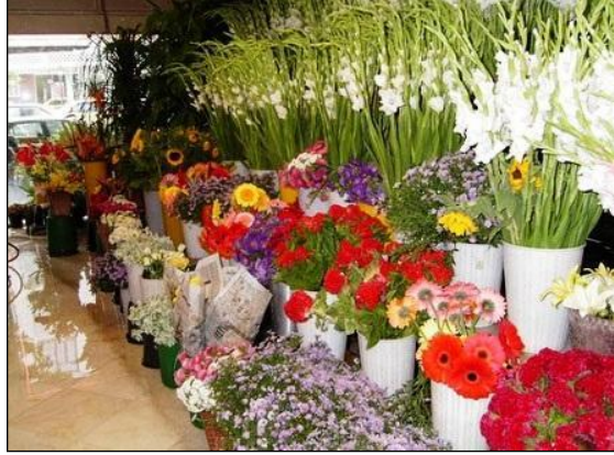
Resim 1.12: Süslemede kullanılan çiçekler

Araç süslemede kullanılacak bazı malzemelerle ilgili olarak şu pratik bilgiler uygulanabilir.