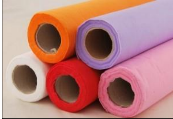
Resim 2.11: Sünnet süslemeleri