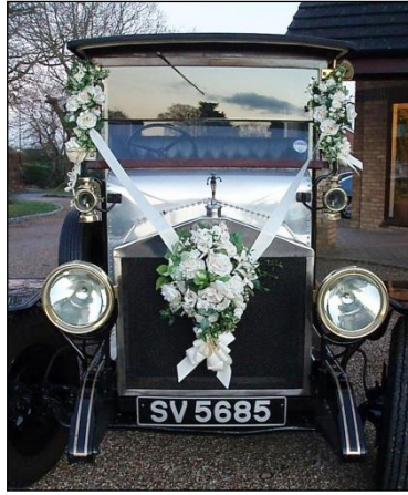
Resim 1.15: Araç ve süsleme uyumu