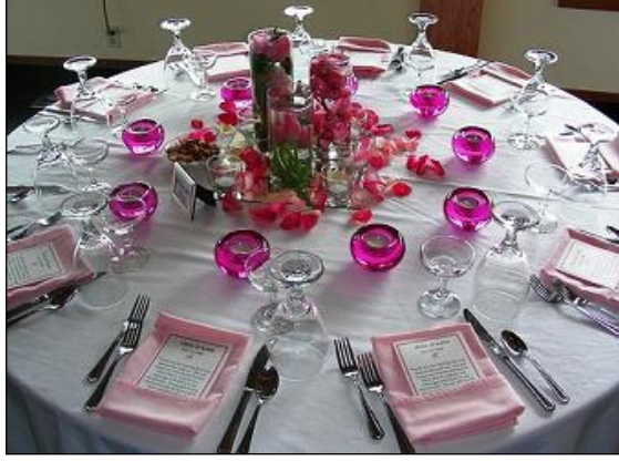
Resim 2.15: Yemek masası

Öncelikle masa örtüsü serilir ve tercihe göre ikinci bir örtü serilebilir. İkinci örtüler isteğe bağlı olarak dantel veya tül olabilir. Masa ortasına yerleşilecek materyaller ise ayna, şamdan, canlı ve yapay çiçek aranjmanlarından oluşur. Yemek masasında yemek düzeni için tabak, bardak, çatal, bıçak, peçete ve peçetelerin yüzükleri masa etrafına yerleştirilir. Masaların üzerine tercihe göre pul, taş, boncuk ve benzeri dekoratif süsler kullanılabilir.