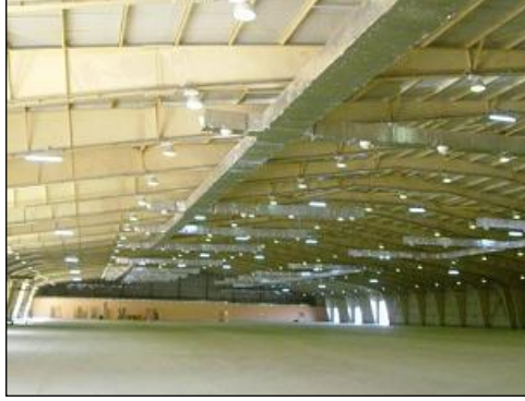
Resim 1.13: Kapalı alan

Tasarım ve süsleme yaşanan mekânların kullanım amaçlarına uygun olarak en verimli, estetik ve sanatsal bir şekilde düzenlenmesidir. Tarih boyunca insanın yaşadığı mekânlar üzerinde çok gelişmeler kaydedilmiş ve bu gelişmeler sonucunda birçok tasarım ortaya çıkmıştır. Dekorasyon olgusu, süsleme sanatı olarak firmalar tarafından iş kolu haline getirilmiş ve mekânlarda insan hayatına renk ve estetik katmak amacıyla tasarım süsleme sanatları gelişme göstermiştir.