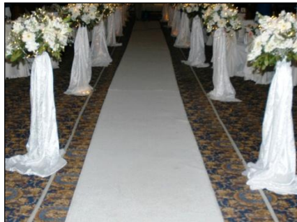
Resim 1.18: Beyaz halı