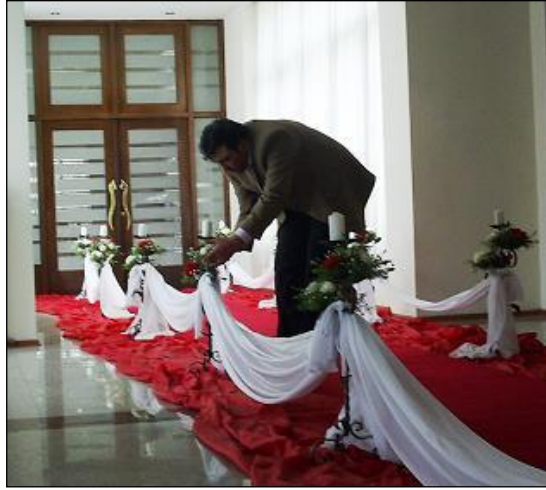
Resim 2.20: Kapalı alanda yol düzenlemesi

Kapalı alanda yol süslemesi, kullanım amacına göre değişir. Resmi davetler ve gala gecelerinde yollar kırmızı şeritlerle ve altın yıldızlı objelerle süslenir. Kullanılacak yolun uzunluğuna göre kırmızı halı serilir. Düğün davetlerinde ise yol kenarları daha gösterişli olması için canlı çiçekler ve mum dekorlarıyla süslenir. Özellikle düzenleme yapılan alan gelin yolu ise sütunlar ve canlı çiçeklerle donatılır.