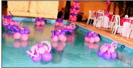
Resim 2.12: Havuz içinde balon süsleme

Havuz yüzeyinde bulunması gereken çiçekler yüzdürücü özelliğe sahip strafor, plastik ve cam simidi gibi objelerin üzerine yerleştirilerek süslenir. Düğün, nişan, doğum günü gibi özel günler için havuz etrafında yapılan organizasyonlarda, havuz içine balon, logo, baş harfleri simgeler konularak yüzdürülür. Böylece günün anlam ve önemi vurgulanmış olur. Ayrıca süslemelerde yüzen çiçekler yanında balon, strafordan kuğu, nazar boncuğu gibi görselliği belirleyici alt yapılardan sıkça yararlanır. Havuz çevresi geceleri mumlarla, gündüzleri minik çiçeklerle süslenerek havuzla kara bağlantısının davetlilere uyarıcı niteliğinde görülmesini sağlar. Havuz içinde kullanılacak ürünleri sabitleme işi karşılıklı gerdirme veya zemine ağırlık konmasıyla yapılır.