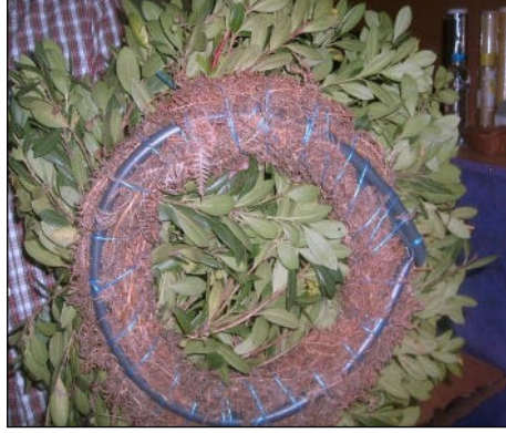
Resim 3.8: Anız ve kurutulmuş otlar

Anız veya kurutulmuş otlar iskelet malzemelerini süslemede kullanılmaktadır. Anız veya bazı kuru ot kalıntıları bir arada tellerle bağlanarak değişik şekiller oluşturulur. Bu amaçla daha çok eğrelti otları bir araya getirilip plastik boru etrafında telle veya iplerle sarılarak çiçek ve yeşilliklerin işlenebileceği zemin oluşturulur.