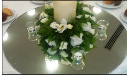
Resim 1.6: Masa üstü ayna