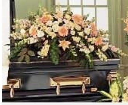
Resim 3.12: Sprey tasarımla süsleme

Süslemede kullanılacak çiçeklerin serpmeye formda hazırlanmasına sprey tasarımla süsleme denir. Sprey tasarımla süslemede, düz aranjman tabakları üzerine sabitlenen çiçek süngeri üzerine çalışılır. Tasarımda en ekonomik seçeneklerden biri tabut üstü spreydir. Sprey tasarımla süslemede kullanılan başlıca yöntemler şunlardır: