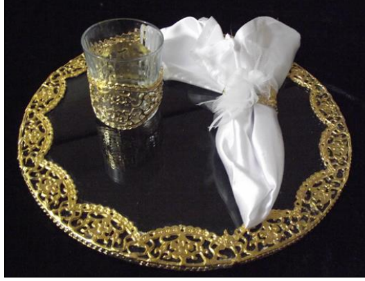
Resim 1.5: Supla