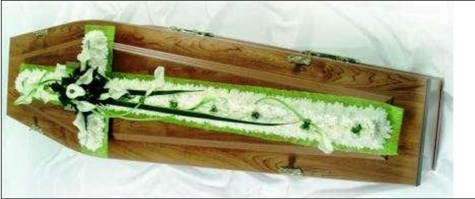
Resim 3.19: Tabut üzeri uygulama