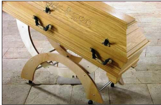
Resim 5.8: Müşteri isteğine göre tasarlanmış katafalk