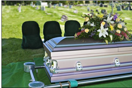
Resim 3.3: Sade şekilde süslenmiş bir tabut

Tabut süsleme, tabutun etrafının inanç veya isteğe bağlı değişik şekillerde ve çiçeklerle süslenmesi olayına denir. Tabut süsleme konusu Müslüman toplumlarda bulunmayan, daha çok Hristiyan inancına sahip toplumların geleneksel cenaze ritüellerinden bir tanesidir. Türkler gibi İslam inancına sahip toplumlarda tabut üzerine eğer ölen kişi şehit ise yalnızca bayrak, gelin olmadan ölen bir genç kız ise gelinlik örtülmesi gibi gelenekler bulunmaktadır.