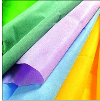
Resim 1.17: Süslemede kullanılan kumaşlar