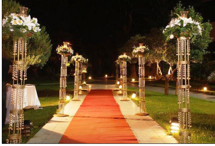
Resim 2.7: Gelin yolu