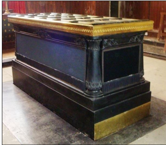
Resim 5.1: Katafalk

Cenaze törenleri dinlere, toplumlara, gelenek ve göreneklere göre değişiklik gösteren bir olaydır. Bu farklılıklardan bir tanesi de ölen kişinin tabutunun, çevresi tarafından son görevlerini yapmak ve gereken saygıyı göstermek için özel olarak tasarlanmış ve katafalk adı verilen bir yerde bekletilmesidir.