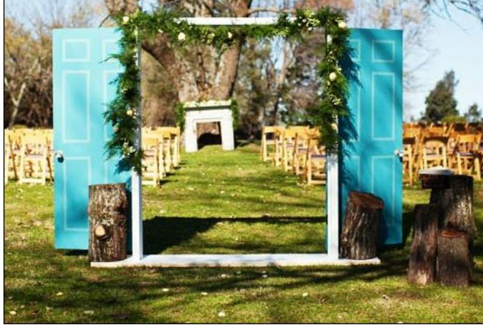
Resim 2.9: Kapı düzenleme organizasyonu

Kapı süslemeleri organizasyonun içeriğine göre değişir. Kapılar müşteri tercihine göre çiçek, tül, şerit veya balonlarla süslenebilir. Nikâh salonu kapısı daha çok tül ve çiçeklerle, doğum günü partileri, açılış, sünnet düğünü gibi organizasyonlarda kapıların süslemesi müşterinin isteğine göre balonlarla yapılabilir.