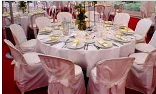
Resim 2.14: Masa düzenlemesi

Kapalı alanlarda masa süslemeleri kullanılan masanın konseptine göre değişir. Yemek masası, nikah masası, kokteyl masası vb. konseptteki masaların farklı farklı dizaynı yapılır.