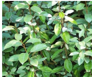
Resim 3.10: Oleaster