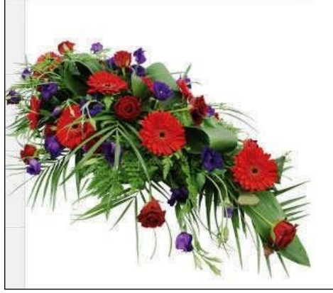
Resim 3.16: Tek yönlü sprej

Tek yönlü sprej, çift yönlü stille aynı şekilde hazırlanır. Fakat farklı olarak bir yönü uzun bir yönü kısa olarak hazırlanır.