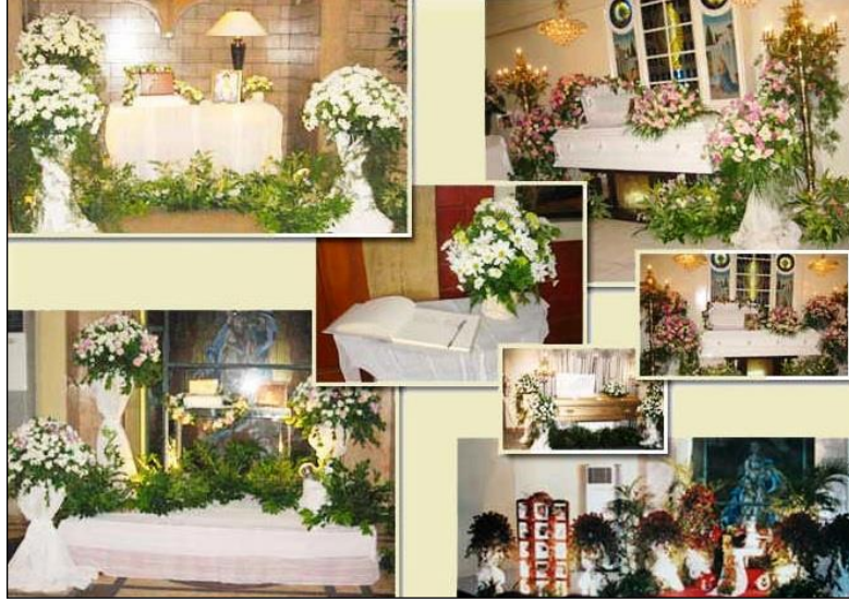
Resim 3.21: Son kontrollerin yapılması

Tabut süslemesi işlemi cenaze töreninden bir gün önce bitirilmelidir. Cenaze töreni sabah olacaksa son kontroller akşamdan, öğlen vakti olacaksa sabahtan yapılmalıdır. Bu şekilde karşılaşılabilecek aksaklıklar sorun oluşturmadan çözümlenmiş olur. Bu amaçla törenden önceki akşam hazırlanan süslemeler kontrolden geçirilir. Çiçeklerin bozulup bozulmadığına bakılır, gerekli düzeltmeler ve aksaklıklar giderilir. Strafor veya anız iskelet kullanımında solmayı engellemek için çiçekler ve yeşillikler hafifçe ıslatılmalıdır.