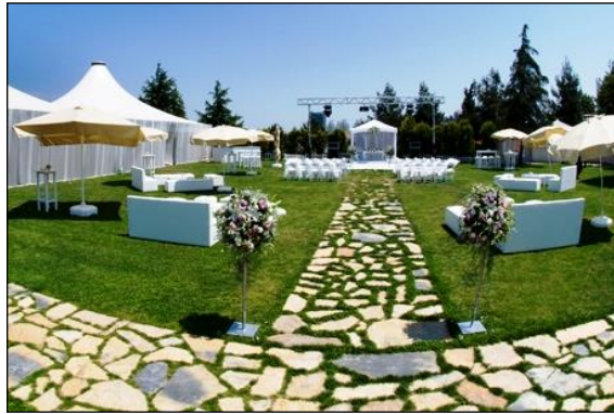
Resim 1.1: Açık alan

Açık alan tasarımı, uygun dönemlerde açık alanlarda hedef kitleye yönelik yaratıcı tasarımların oluşturulması ve bu tasarımların düzenlenmesi ile hizmet sunulması olarak algılanmalıdır.