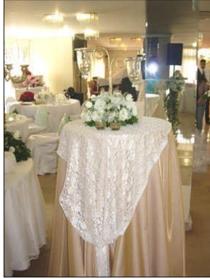
Resim 2.30: Kokteyl masası süsleme