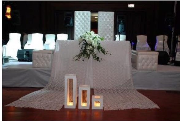
Resim 2.16: Nikah masası

Kapalı alanda nikah masası süslenirken dantel ve özel örtüler tercih edilmelidir. Lake nikah masalarında örtü kullanılmaz. Örtü yerine taşlar veya çiçeklerle süsleme yapılmalıdır. Mutlaka örtü kullanılmak isteniyorsa, masanın ayaklarını örtecek şekilde ve biraz da zemine dökümlü duracak şekilde düzenlenmelidir. Nikah masası üzerine canlı çiçek aranjmanı kullanılır. Bu aranjmanda düğün rengi olan beyaz renk tercih edilmelidir. Uzun nikah masalarında çiçek aranjmanı her iki uç ve cepheye gelecek şekilde yerleştirilir. Masaya tek aranjman konulacağı zaman masanın ön cephesinin ortasında veya uç kısmında dizayn edilir.