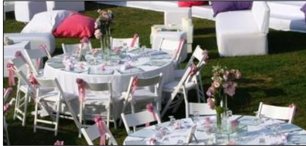
Resim 2.3: Yemek masaları

Yemek masalarında açık renkli ve beyaz saten örtüler masa örtüsü olarak tercih edilir. Masa ortasına ayna, şamdan ve canlı çiçek aranjmanları yerleştirilir. Aranjmanlar bol cipsolu, bol yeşillikli hazırlanır. Canlı çiçekler sıcaklığa dayanıklı türlerden seçilmelidir. Aranjmanlarda sık kullanılan canlı çiçekler; lilyum, gül, anterium çiçekleridir. Yemek masasında yemek düzeni için tabak, bardak, çatal, bıçak, peçete, peçetelerin yüzükleri masa etrafına yerleştirilir. Peçeteler masa örtüsü kumaşı ile peçetelikler ise kapak masa örtüsü ile uyumlu olmalıdır. Masaların üzerine pul, taş, boncuk vb. dekoratif malzemeler kullanılır.