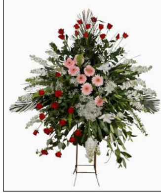
Resim 1.11: Ferforje