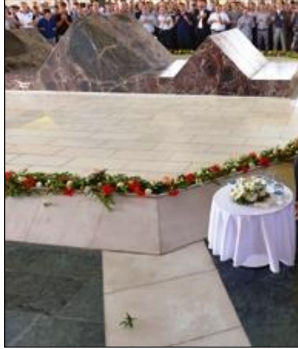
Resim 4.9: Anıt mezarda çiçeklerle yapılan süsleme