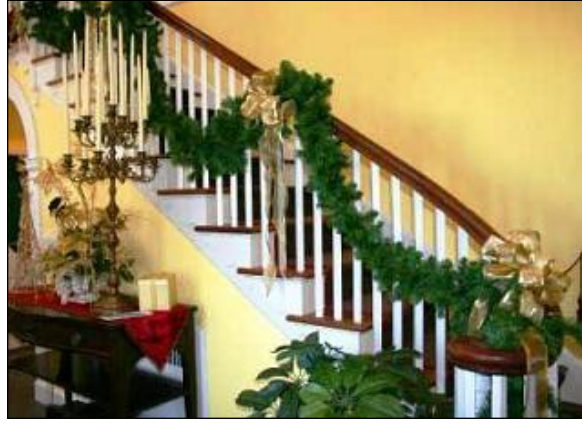
Resim 2.21: Merdiven süsleme

Kapalı alanlarda merdivenlerin süslenen kısımları genellikle merdiven korkuluklardır. Korkuluklar çiçek aranjmanları, tül veya kumaşlarla süslenir. Ayrıca değişik vazolarla merdiven kenarlarına değişik estetik görünümler katılabilir. Merdivenlerde müşteri tercihine göre ışıklandırma, mumlar vb. objelerle süsleme yapılabilir. Çiçeklerle süsleme yapılan basamaklarda halı kullanılmamalıdır. Düğün, nişan, kutlama gibi organizasyonlarda merdivenler canlı çiçeklerle daha gösterişli şekilde süslenir. Fakat kapalı alanda resmiyet içerikli organizasyonlarda merdiven korkulukları daha sade şeritlerle süslenir.