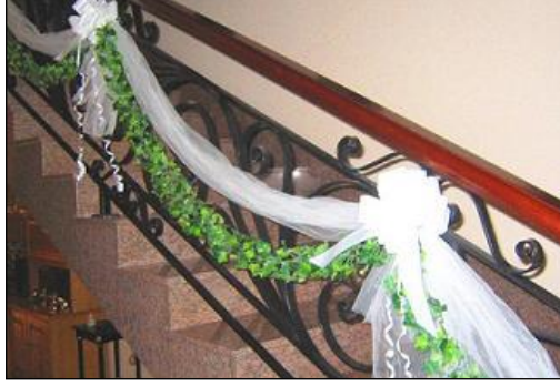
Resim 2.29: Merdiven süsleme