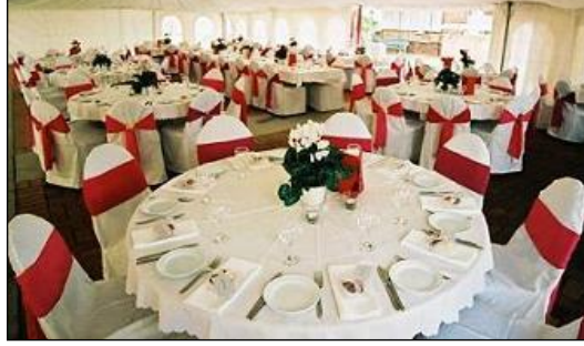
Resim 2.25: Düzenlenmesi yapılmış masalar

Süsleme malzemeleri düzenlemenin yapılacağı alana götürülür. Süslemeye önce masalar ile başlanır. Masalara örtü serilir, üzerine ayna, mumlar ve suplalar yerleştirilir.