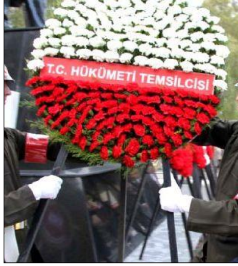
Resim 4.6: Çelenk

Anıt tasarımında çelenk haricinde canlı çiçek, yeşillik, anız veya kurutulmuş otlar, makas, bıçak, bant, kumaş (siyah ve beyaz renkte), kurdele (siyah renk), pirinç bariyerler ve kırmızı kuşaklar ile diğer aksesuarlar kullanılmaktadır.