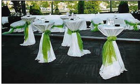
Resim 2.5: Kokteyl masaları

Açık alanlarda kokteyl masası olarak genellikle lake masalar, lake sehpalara ve küçük oturma grubunda şeklindeki konseptler kullanılır. Kokteyl masalarında kullanılacak örtü masanın lake, cam, ayna vb. olmasına göre değişir. Cam ve ayna masalarda masa örtüsü kullanılmayabilir. Kokteyl masası hazırlanırken genellikle canlı fanuslu çiçekler tercih edilir, fakat alan kaplayan ve büyük gösterişli çiçekler pek tercih edilmez.