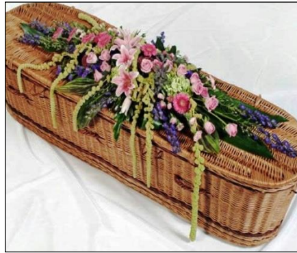
Resim 3.13: Çift yönlü sprej

Bu yöntemde çift yönlü sprej tabutun üzerine yerleştirilir. Uygulanacak tasarım tabutun yaklaşık 2/3 büyüklüğünde hazırlanmalıdır. Tasarımda gerbera, sprej karanfil, karanfil, lilyum gibi çiçekler ve orta küçük yapraklı yeşillikler kullanılmalıdır. Yapım aşamaları aşağıdaki gibidir: