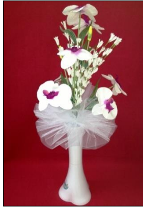
Resim 1.10: Fil ayağı