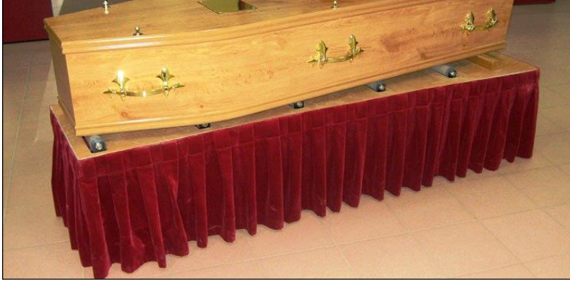
Resim 5.9: Kumaş örtülmüş katafalk