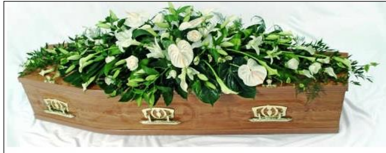
Resim 3.15: Tamamlanmış çift yönlü spreyci süsleme