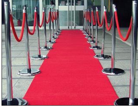
Resim 1.19: Kordon bariyerler

➤ Kokteyl alanı düzenlemesinde kullanılan malzemeler