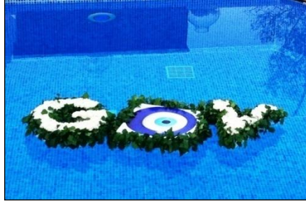
Resim 2.11: Havuz içinde logo düzenlemesi

Açık alandaki havuz süslemeleri parti, özel günler gibi kullanım amacına göre farklılık gösterir. Özel günler ve kurumsal yemekler havuz etrafında yapılacak ise etkinliğin ve süslemenin toplu halde net görüntünün havuz üzerine yansıtılması sağlanır. Örnek olarak etkinlik bir iş yemeği ise havuz üzerine firma logoları, yıl dönümü sayıları, rakamları konularak etrafına yüzen çiçek dizaynları yapılır.