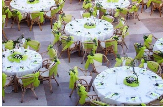
Resim 2.2: Yuvarlak masalar

Masalar açık alandaki kullanım amaçlarına göre değişiklik gösterir. Açık alanda kullanılan yemek masası, kokteyl masası, nikâh masası gibi konseptteki masaların farklı farklı dizaynı yapılır. Daha çok kare, yuvarlak, piknik masalar tercih edilir.