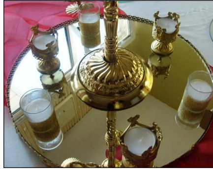
Resim 1.15: Masa üstü ayna