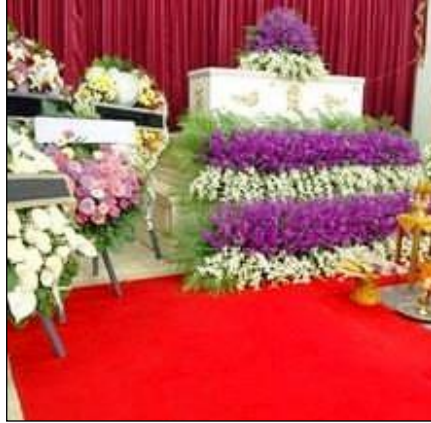
Resim 3.1: Tabut süsleme organizasyonu

Doğal bir olay olan ölüm sonrası, ölen kişinin akrabaları ve yakın çevresi onu daha iyi anılarla hatırlamak isterler. Bunun cenaze törenlerinde bile en iyi yolu çiçeklerdir. Bu nedenle geçmişten beri cenaze törenlerinde tabutun değişik şekillerde ve çiçeklerle süsleniği bilinmektedir.