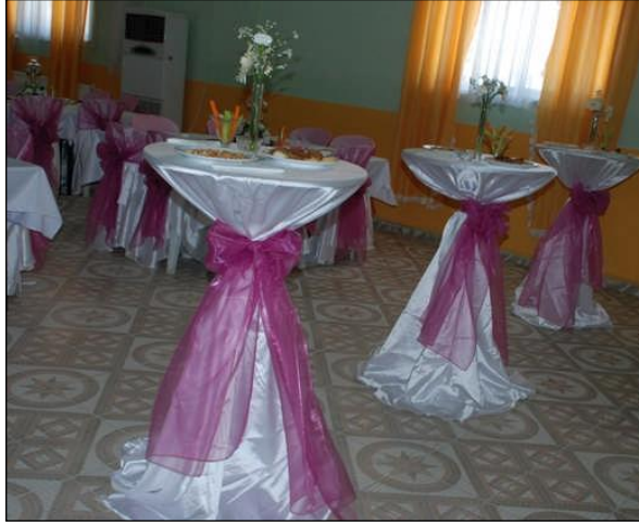
Resim 2.17: Kokteyl masaları

Kokteyl masalarında kullanılacak örtü masanın lake, cam, ayna vb. olmasına göre değişir. Cam ve ayna masalarda örtü gereksinimi zorunlu değildir. Kokteyl masası tasarımında daha çok canlı fanuslu çiçekler tercih edilir. Masa üzerinde küçük objeler veya sadece mum kullanılabilir. Kişinin isteğine göre küçük şamdanlar veya yalnızca çiçek partelleri de tercih edilebilir. Burada kullanılan malzemenin masa boyutuna uyması önemlidir. Alan kaplayan ve büyük gösterişli çiçekler pek tercih edilmez.