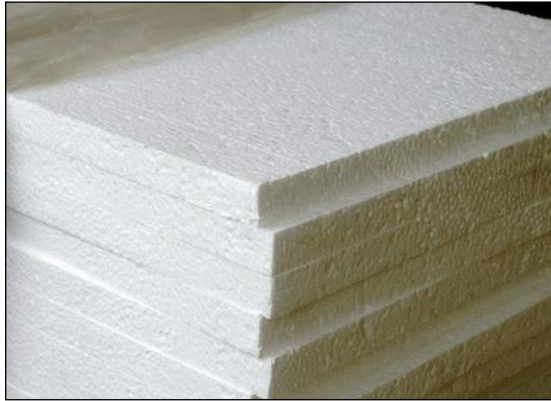
Resim 3.7: Strafor

Strafor, hafif ve taşınması kolay olan ve bu nedenle tabut süslemede tercih edilen bir malzemedir. Tabut üzerine konulacak strafora kalp, simit, haç gibi değişik modellerde şekil verilerek üzeri süslenecek bir iskelet oluşturulur. Strafor, ıslatılmadığı için oasis'e göre daha hafif kullanımlı bir malzemedir.