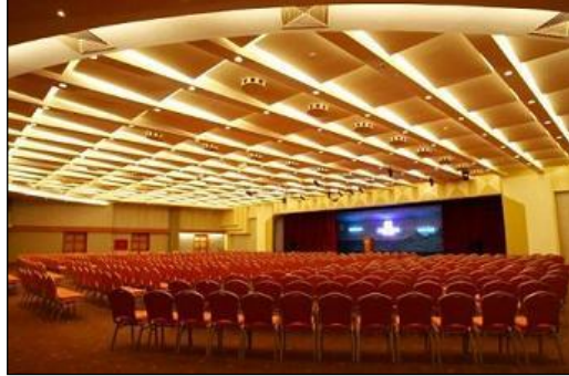
Resim 2.13: Kapalı alan

Kapalı alan süslemesi yapılırken, alanda bulunması gereken başlıca unsurlar masa, sandalye, yol, merdiven, kapı ve taktır.