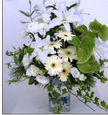
Resim 1.16: Çiçek aranjmanı