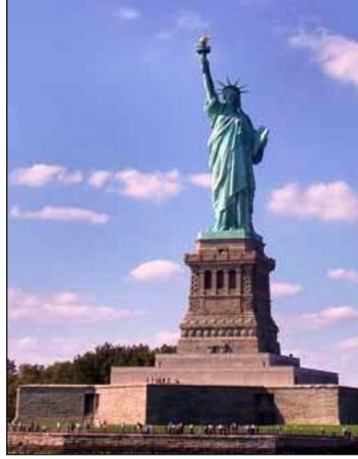
Resim 4.4: Özgürlük heykeli

Anıtlar toplumların geçmişlerinden geleceğine ışık tutan eserlerdir. Bir milletin tarihi değerlerinin yansıtıldığı bu anıtların ulusal günlerde ve törenlerde süslenerek halkın ziyaretine açılması büyük önem taşımaktadır.