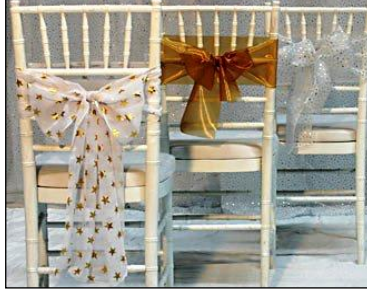
Resim 1.8: Tiffany sandalye