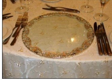
Resim 1.14: Supla