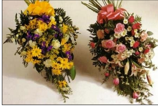
Resim 3.17: Tek yönlü saplı sprej

Bu yöntemde süsleme yapılırken tek yönlü sprejle ile aynı yöntem izlenir. Kesilen çiçek sapsarı kısa olan kısımdan çiçek süngerine sapsarı. Tasarımın üst kısmı tamamladıktan sonra, aranjmanın alt kısmına yapraklar döşenerek çiçek süngeri kaplanır. Kullanılan çiçeklerin sapsarı temizlenerek aranjmanla orantılı boyda süngere sapsarı.