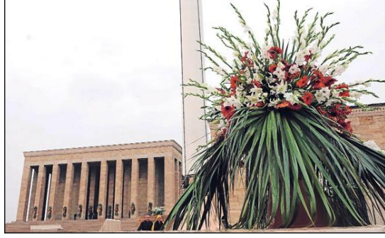
Resim 4.12: Anıtkabirde çiçeklerle süsleme

Süslenecek anıtın kolonlarına ve köşe kısımlarına kumaşla süsleme yapılmalıdır. Siyah ve beyaz tonlarda kullanılacak kumaşların üzerine siyah renkli kurdeleler kullanılmalıdır.