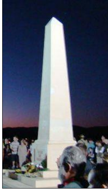
Resim 4.10: Anıtta yapılan gece töreni