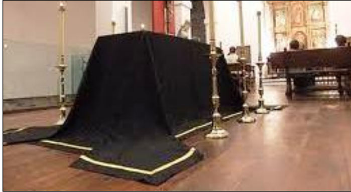
Resim 5.14: Alanın son kontrolü

Katafalk alanında son kontroller yapılır. Görülen veya bildirilen aksaklıklar süslemede görevli personel tarafından giderilir. İlgililer tarafından bildirilen ve yapılması gereken değişiklikler tamamlanır. Alan son bir kez kontrol edilerek törene hazır olup olmadığı ilgili kişilere bildirilir.