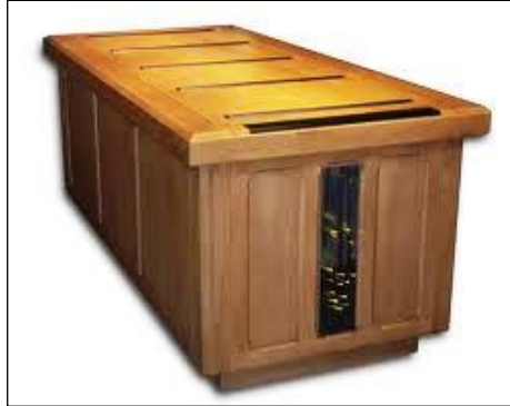
Resim 5.6: Ağaçtan yapılmış katafalk

Katafalklar cam, ağaç ve metal gibi malzemelerden imal edilmektedir. Müşteri isteğine özel olarak imal edilen bazı katafalk tasarımları da bulunmaktadır.