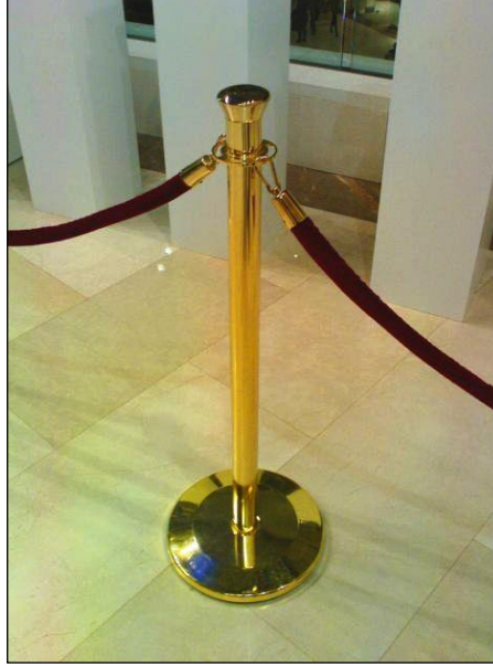
Resim 4.8: Piriñç bariyer