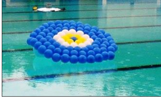
Resim 1.12: Havuz içinde balonlar