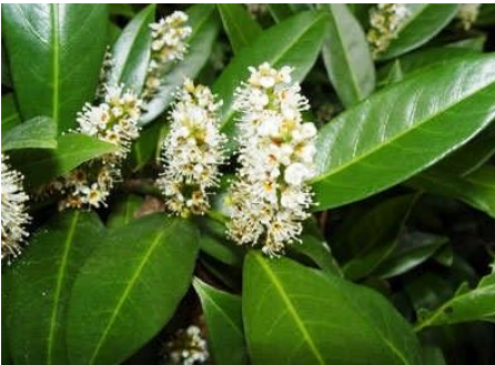
Resim 3.9: Kocayemiş

Yeşil bitkiler; tabut süslenirken alt yapı ve örtü malzemesi olarak kullanılır. Ayrıca süslemeye doğal bir görünüm katmak amacıyla da kullanılır. Tabut süslemede kullanılan başlıca yeşil bitkiler; kocayemiş, defne, şimşir, sarmaşık, okaliptüs, ruskus, manolya, selvi ve oleaster bitkileridir.