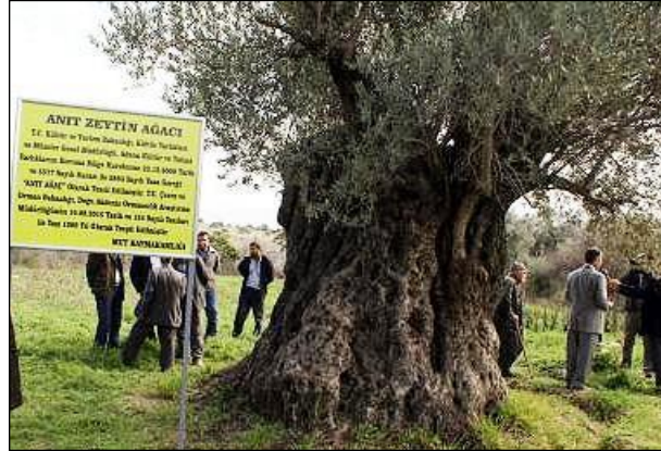
Resim 4.5: Anıt ağaç

Anıtlar farklı şekillerde dizayn edilmiş yapılar veya heykel şeklinde olabilir. Bunun yanında bazen ağaçlar da anıt olarak kabul edilmektedir. Zafer takları da tarihteki önemli anıt örnekleridir. Romadaki büyük zafer takları Romalı generallerin, Paristeki ünlü Zafer Takı, Napolyon ordularının savaşta kazandıkları zaferlerin anısına dikilmiştir.