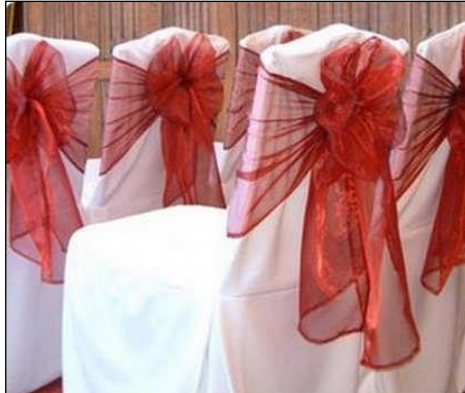
Resim 2.18: Giydirilmiş masalar

Kapalı alanda sandalye süslemesinde kullanılacak sandalye modeli daha çok müşterinin tercihinine ve alana göre değişir. Düğün süslemelerinde kapalı alanda daha çok süslü objeler tercih edilirken, resmi toplantılarda ise daha sade objelere yer verilir. Süsleme yapılacak sandalyelere isteğe göre önce streç kılıflar giydirilir. Tercih edilen renkte fiyonklarla bağlanıp arka cephesi canlı çiçeklerle süslenir.