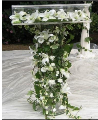
Resim 4.13: Konuşma kürsüsünün süslenmesi

Anıt süsleme yapılırken tören konuşmaları için hazırlanmış olan platform veya kürsünün de süslenmesi gereklidir. Bu amaçla çiçekle süsleme yapılmalıdır. Yapılacak aranjmanlar platform ebatlarına göre değişebilmektedir. Çiçek renkleri kişi tercihinine göre değişmekle beraber, beyaz ve kırmızı tonların hâkim olduğu çiçekler kullanılmalıdır. Yine süslemede kullanılacak çiçekler mevsime göre değişmektedir.