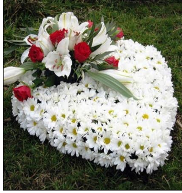
Resim 3.20: Kişiliği yansıtıcı süsleme organizasyonu