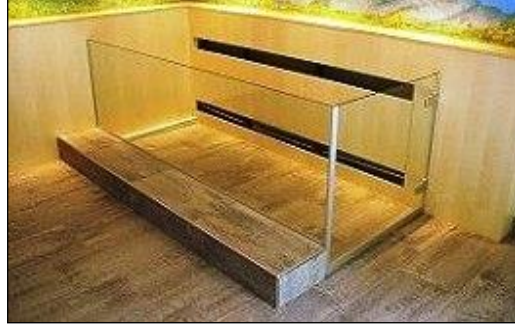
Resim 5.7: Cam katafalk