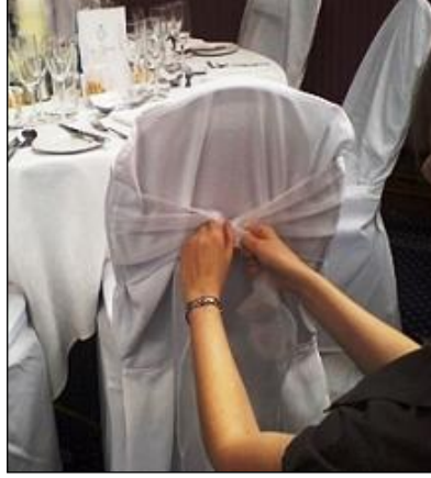
Resim 2.27: Sandalye süsleme