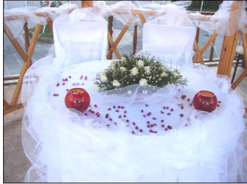
Resim 2.26: Çiçeklerin yerleştirilmesi

Çiçekler en sona bırakılır. Çiçekler en sona bırakılması gerektiği için şamdanlar masaya en son konmalıdır. Masa çiçeğinin altına sandalye dekorasyonunda kullanılan kumaş şeritler serilir. Sade veya renkli çiçeklerle masa ortası aranjman yapılır veya masa ortası gümüş, kristal şamdanlarla ışıklandırılır.