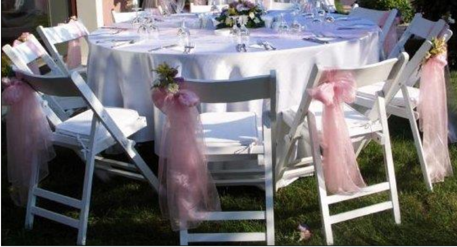
Resim 2.6: Fiyonklarla süslenmiş tiffany sandalyeler

Açık alanda kullanılacak sandalyeler, alanın kullanım amacına ve müşterinin tercihinine göre değişir. Açık alanlarda çoğunlukla fiyonklarla süslenen tiffany sandalyeler kullanılır, giydirme sandalyeler pek tercih edilmez. Resmi toplantılarda ise daha sade sandalyeler kullanılmalıdır. Sandalyeler tercih edilen renkte fiyonklarla bağlanıp, arka cephesi canlı çiçeklerle süslenebilir. Son yıllarda sadece fiyonk bağlanıp veya çiçeklerle, kurdelelerle basit süslemeler yapılan dekoratif sandalyeler tercih edilmektedir. Açık alanlarda, özellikle havuz başı süslemelerinde daha çok beyaz renkte sandalyeler tercih edilmektedir.