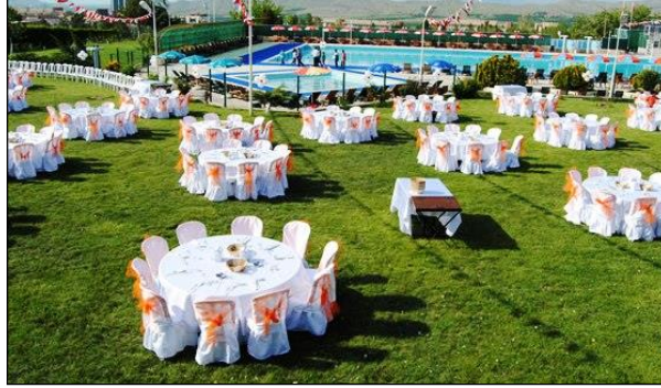
Resim 1.2: Kır düğünü yapılacak alan

Açık alan tasarımında, kapalı alanlar dışında kalan yerler açık alan ve bu alanların tasarımını da açık alan tasarımı olarak adlandırılır. Açık alanlar içerisinde parklar, bahçeler, piknik alanları, yaylalar, havuz başları, açık hava tiyatroları, spor tesisleri gibi sosyal mekânlar bulunmaktadır. Kış dönemlerinde pak ziyaretçisi bulunmayan bu alanlara, yaz döneminde sıcaklığın artması ile bir insan akını başlar.