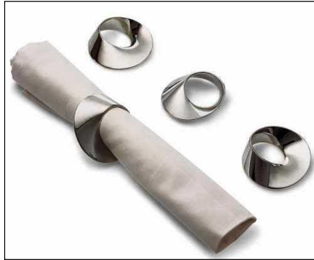
Resim 1.4: Peçete ve peçetelikler