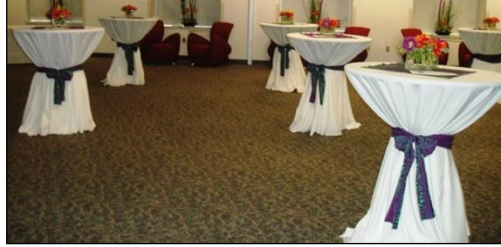
Resim 1.20: Bistro masalar