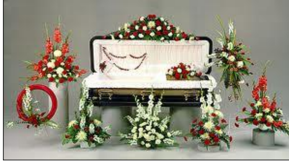
Resim 3.4: Tabut süslemede kullanılan aranjmanlar

Tabut süslenirken üzerine, yanına veya etrafına değişik aranjman veya çelenk süslemeleri ile farklı şekiller yapılmaktadır. Tabut süslenirken çiçek düzenlemeleri farklı şekillerde uygulanmıştır. Bu amaçla mutlu günleri sembolize eden çiçekler bulunduğu gibi, hüznü günleri temsil eden çiçekler kullanılmıştır. Tabut, tabut üstü ve etrafı, cenaze çelenkleri şeklinde süslemeler bazı inanç toplumlarının vazgeçilmez unsurları olmuştur. Özellikle de Hristiyan inancına mensup kişilerde en fakirinden en zenginine kadar bütün kesimde tabutlarda mutlaka haç işareti süslemeleri uygulanmaktadır.