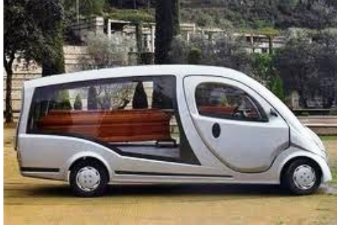
Resim 5.5: Özel olarak dizayn edilmiş araç

Katafalklar cam, ağaç ve metal gibi malzemelerden imal edilmektedir. Müşteri isteğine özel olarak imal edilen bazı katafalk tasarımları da bulunmaktadır.