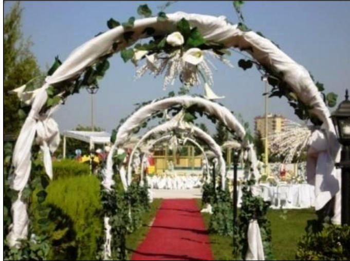
Resim 2.10: Çiçeklerle süslenmiş taklar

Taklar genellikle canlı çiçekler ile süslenir. Daha az maliyet istenilirse cansız çiçeklerde tercih edilebilir. Tak hazırlamak için 190 cm yükseklikte ferforjeler kullanılır. Bol yapraklarla ve aralarına papatya, kasımpatı gibi canlı çiçekler serpiştirilerek süslemeler yapılır. Bazı organizasyonlarda balon takı yapılabilir. Sünnet düğünü, doğum günü, açılış gibi çeşitli etkinliklerde balonlarla tak süslemesi sıkça yapılır.