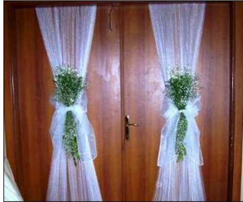
Resim 2.22: Kapı süsleme

Kapalı alanlarda kapılar tercihe göre tül, çiçek, şerit veya balonlarla süslenir. Bu süslemeler organizasyonun içeriğine göre değişir. Nikâh salonu kapısı daha çok tül ve çiçeklerle, doğum günü partileri, açılış, sünnet düğünü gibi organizasyonlarda kapıların süslemesi müşterinin isteğine göre balonlarla yapılabilir.