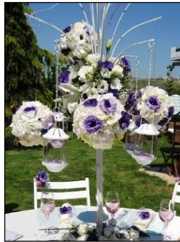
Resim 1.7: Şamdan