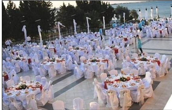
Resim 2.1: Açık alanda düğün organizasyonu

Açık alan süslemesi yapabilmek için, açık alanda kullanılacak alet ve malzemelerin bilinmesi gereklidir. Açık alan süslemesi ile ilgili bilgiler aşağıda anlatılmıştır.