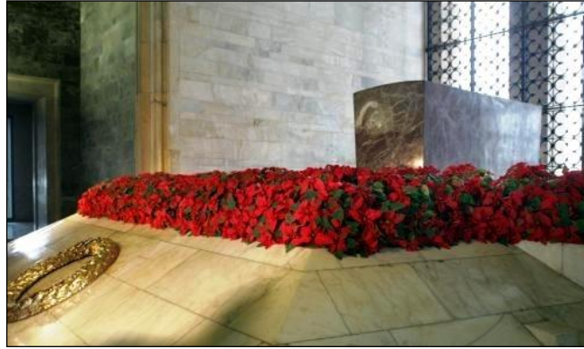
Resim 4.7: Anıtkabirde canlı çiçeklerle yapılmış süsleme

Anıt tasarımı yapılırken kullanılacak çiçekler özenle seçilmelidir. Çünkü çiçeklerin farklı anlamları bulunmaktadır. Anıtta yapılacak anma töreninin özelliğine göre çiçek seçimi yapılmalıdır. Örnek olarak beyaz karanfil temizlik ve saflığı, kırmızı karanfil sevgiyi, sarı karanfil hüznü, krizantem ölümü, liliyum masumiyeti, iris sadakat ve umudu, glayöl ilahi gücü ifade eden çiçekler olarak bilinir.