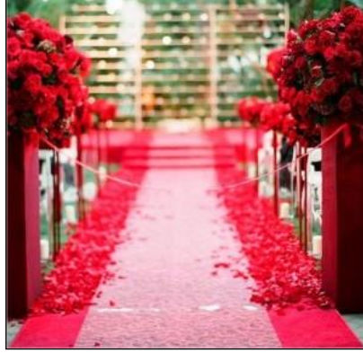
Resim 1.9: Kırmızı halı