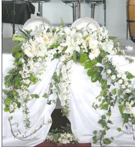
Resim 2.24: Süsleme organizasyonu

Kapalı alanlarda süslenecek başlıca donatılar, masalar, sandalyeler, kapılar, yol, tak ve merdivenlerdir. Kapalı alanlarda süslemede kullanılacak başlıca aparatlar ise çiçekler, tüller, kristal taşlar, balonlar ve diğer dekoratif malzemelerdir.