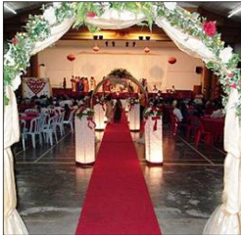
Resim 2.28: Gelin yolu düzenleme