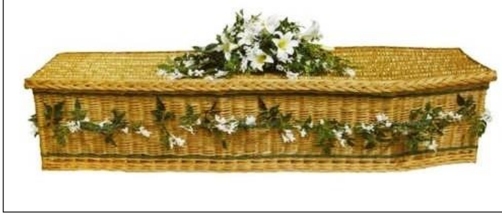
Resim 3.11: Süslemede kullanılan bitkiler