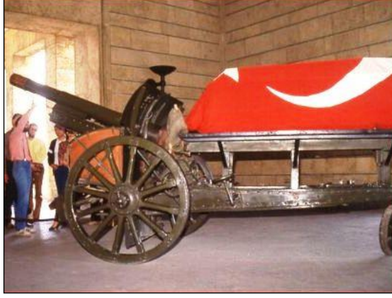
Resim 5.13: Devlet töreninde kullanılan katafalk

Devlet törenlerinde, protokol kurallarına uygun şekilde katafalk hazırlanmalıdır.