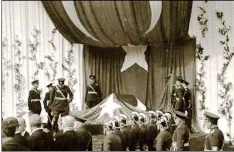
Resim 5.3: Atatürk'ün cenaze töreni

Katafalk, günümüzde hemen her ülkede toplumun her kesimi tarafından cenaze törenleri sırasında kullanılan bir araç haline gelmiştir. Katafalk hem devlet törenlerinde hem de bireysel cenaze törenlerinde dizayn edilerek kullanılmaktadır. Ülkemizde Atatürk'ün ölümü sonrası düzenlenen cenaze töreninde katafalk kullanılmıştır.