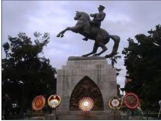
Resim 4.11: Atatürk anıtının çelenklerle süslenmesi

Anıt süslemenin ana materyali çelenklerdir. Çelenkler anıtta yapılacak törenin içeriğine göre seçilmelidir. Resmi bir tören ise kırmızı tonların hâkim olduğu çelenkler kullanılmalıdır. Çelenkerin hazırlanmasında siyah krapon kâğıdı kullanılmalıdır.