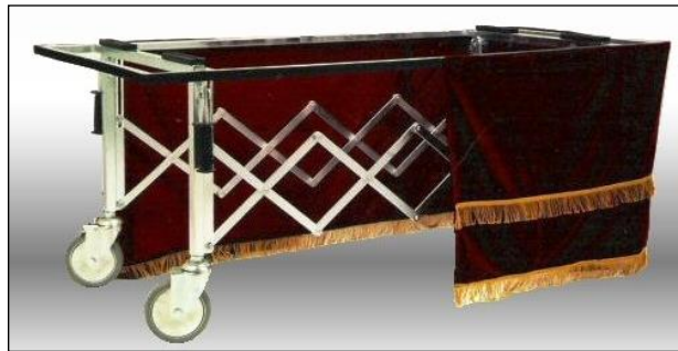
Resim 5.12: Kumaşla süsleme

Katafalkın konulacağı zeminde kumaş süsleme yapılmalıdır. Tercihe göre değişmekle beraber zeminde kırmızı renkli kumaş kullanılmalı, orta kısma katafalk ve dört köşeye beyaz renkli çiçeklerin yoğunlukta olduğu ayaklı aranjmanlar yerleştirilmelidir.