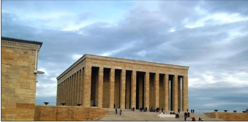
Resim 4.3: Anıtkabir

Ülkemizde bulunan ünlü anıtların başında Anıtkabir, Çanakkale Şehitler Abidesi ve Samsun Atatürk Onur Anıtı; dünyadaki ünlü anıtlar arasında ise A.B.D.’de bulunan Özgürlük Anıtı ve Brezilya’da bulunan Kurtarıcı İsa heykeli gelmektedir.