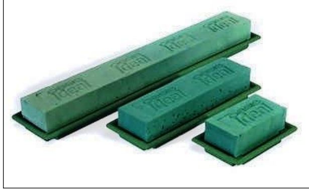
Resim 3.6: Oasis