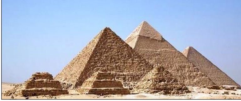
Resim 4.2: Mısır piramitleri

Büyük ve önemli bir olay veya kişinin gelecek kuşaklarca anılması için yapılan, göze çarpacak büyüklükte ve simge niteliğinde yapıya anıt adı verilir. Anıtların yapılış amacı, bir kişinin, olayın veya tarihsel bir dönemin anısını canlı tutmaktır. Örnek olarak Mısır piramitleri anıtmezar şeklinde yapılmış olup oraya gömülen kralların anılarını yaşatmak amacıyla yapılmışlardır. Yine dünyanın pek çok yerinde meydan ve caddelerde tek bir kişinin anısına dikilmiş anıtlara rastlanır.