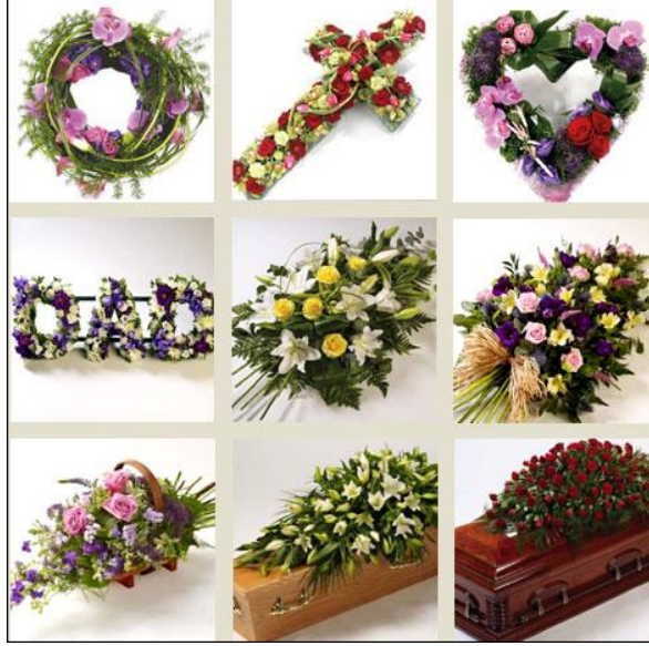
Resim 3.2: Süslemede kullanılan değişik uygulamalar

Ölüm ve ölen kişi ile ilgili âdetler ve uygulamalar, ölüm öncesinden başlar, ölüm sonrasında da devam eder. Bu âdet ve gelenek göreneklerden bir tanesi de bazı toplumlarda tabutun süslenmesidir.