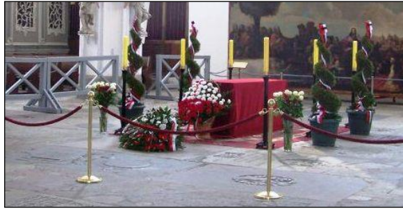
Resim 5.11: Süslemesi tamamlanmış katafalk

Katafalk süslemede çiçekler sprej olarak kullanılabilceği gibi, aranjman şeklinde de kullanılabilir.