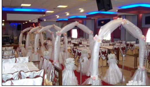
Resim 2.23: Tak düzenlemesi

Takların süslemede genellikle canlı çiçekler kullanılır. Maliyet az olsun istenilirse cansız çiçeklerde tercih edilebilir. Bazı organizasyonlarda balon takı da yapılabilir.