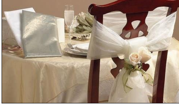
Resim 2.19: Çiçekle süslenmiş masalar

Fakat son yıllarda daha çok dekoratif sandalyeler tercih edilmektedir. Bu sandalyelere sadece fiyonk bağlanıp veya çiçeklerle, kurdelelerle basit süslemeler yapılmaktadır. Kapalı alanlarda Hilton tipi sandalyeler kullanılır ve daha şık durması için giydirme yapılır.