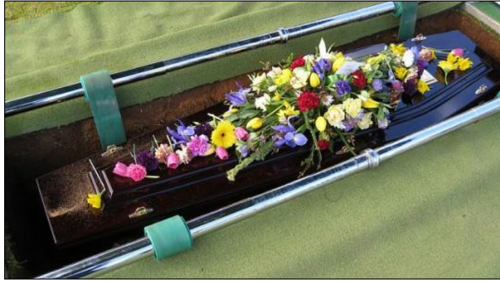
Resim 3.5: Çiçeklerle süslenmiş tabut

Bazı özel günlerde hazırlanan çiçek düzenlemeleri mutluluğumuzu anlatırken, cenaze gibi üzüntülerimizi ve vedalarımızı ölen kişiye olan sevgimizi ve bağlılığımızı da çiçeklerle ifade edebiliriz. Doğumda insanoğlu çiçeklerle karşılanırken ölümden de çiçeklerle uğurlamalar günümüzde normal karşılanmaktadır.