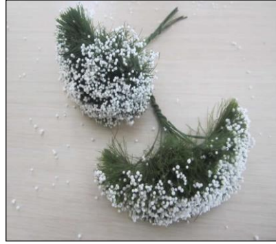
Resim 1.22: Cipso