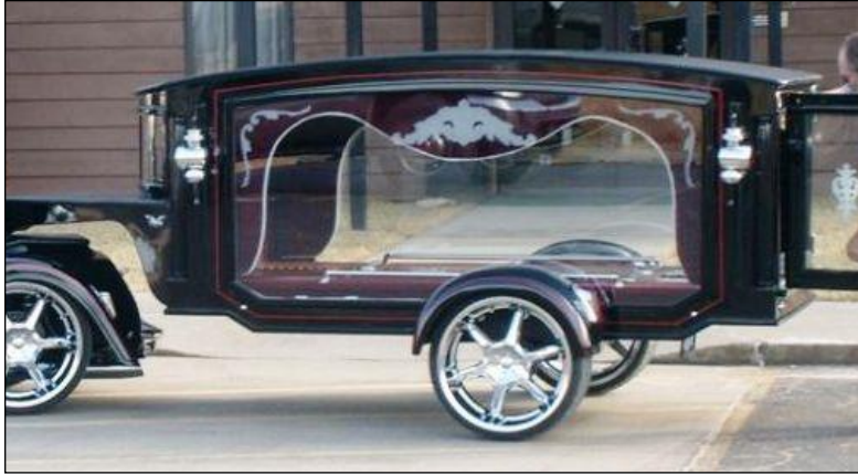
Resim 5.10: Katafalk olarak hazırlanmış araç

Katafalk süslemesi bir plan dâhilinde yapılmalıdır. Aksi takdirde düzenleme ve süslemeler zamanında bitmeyebilir.