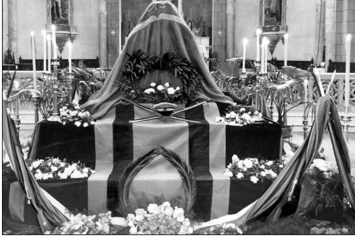
Resim 5.2: Cenaze töreni için katafalk organizasyonu

Önünden geçilerek, kendisine saygı gösterilmek istenen ölünün tabutunun konulması için yapılmış yüksek yere katafalk ad verilir. Bu gelenek tarihin eski dönemlerinden beri pek çok toplumda uygulanmaktadır.