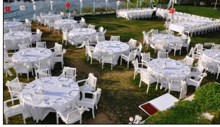
Resim 1.3: Yuvarlak ve kare masalar