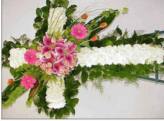
Resim 3.18: Haç şeklinde süsleme