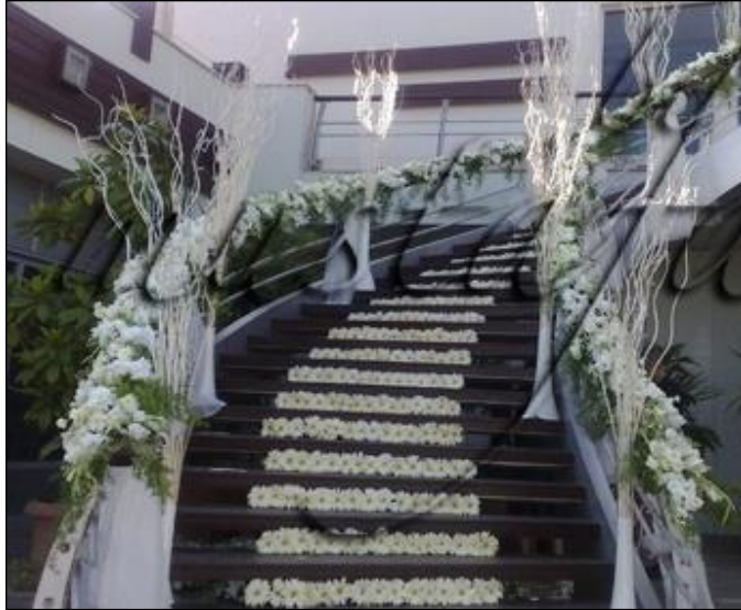
Resim 2.8: Merdiven süsleme

Merdiven süslemelerinde genellikle yeşil yapraklar, tül, canlı ve cansız çiçekler kullanılır. Düğün, nişan, kutlama gibi organizasyonlu açık alanlarda merdiven süslemelerde canlı çiçeklerle daha gösterişli objelerle süslenir. Çiçekle süsleme yapılan basamaklarda halı kullanımı tercih edilmez. Merdiven korkulukları çiçek aranjmanları, tül veya kumaşlarla süslenir. Aynı zamanda değişik vazolarla merdiven kenarlarına değişik estetik görünümler katılabilir. Merdivenlerde müşteri tercihinine göre ışıklandırma yapılabilir veya mumlar süslenir. Kumaşlarla süsleme daha çok iş yemekleri gibi sade törenlerde tercih edilirken, balonlarla süslemeler ise sünnet düğünlerinde kullanılır.