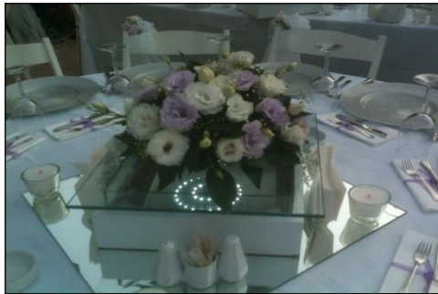
Resim 1.21: Masa üzeri dekoratif objeler