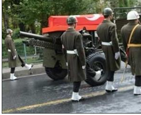
Resim 5.4: Katafalk olarak kullanılan top arabası