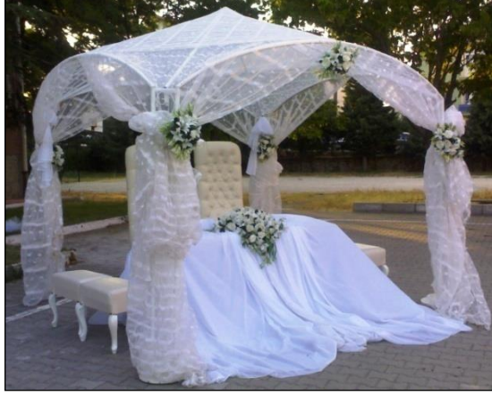
Resim 2.4: Nikah masası

Nikah masaları süslenirken genellikle dantel ve özel örtüler tercih edilmelidir. Fakat lake nikah masası tercih edilirse örtü yerine taşlarla veya çiçeklerle süsleme yapılmalıdır. Örtü kullanılacak ise masanın ayaklarını örtecek şekilde ve biraz da zemine dökümlü durması ayarlanarak düzenlenmelidir. Masa üzerine orkide, anterium, ortanca gibi gösterişli ve göz alıcı canlı çiçekler aranjman olarak kullanılır. Nikâh masaları uzun ise çiçek aranjmanı her iki uca ve cepheye gelecek şekilde yerleştirilir. Masaya tek aranjman konulacağı zaman masanın ön cephesinin ortasında veya uç kısmında dizayn edilir. Açık alanda yapılan nikâh masası süslemelerinde canlı çiçeklerle oluşturulmuş kubbeler dizayn edilir. Bu kubbelerin süslemesinde canlı yeşil yapraklar ve tüller de kullanılır.